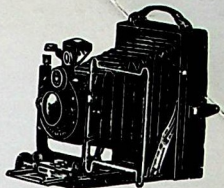
FOLDING SOM Formats 6 1/2 x 9 - 9 x 12 pour plaques et film-packs

Appareils à plaques Modèle colonial 6 1/2 x 9 et 9 x 12