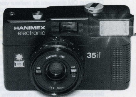
Le super compact Hanimex 35 IF

Il est compact, automatique et il a un flash incorporé. Pour photographier la nuit ou à l'intérieur, poussez le flash. Le témoin lumineux s'allume, vous prenez votre photo, le flash se recharge immédiatement, vous prenez des dizaines de photos.