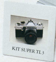
KIT SUPER TL 3

KIT MTL 3 : le plus compétitif des semi-automatiques. Il comprend un boîtier semi-automatique, un objectif Pentacon 1,8/50, un grand angle 2,8/29 et un téléobjectif 2,8/135. Ce Kit très complet donne accès à tous les domaines de la photo.