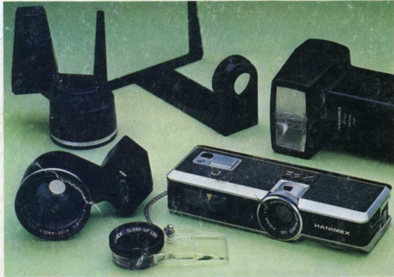
Pocket XP2. 26 mm f/5,6 : 368 F + compléments optiques.