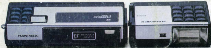
Pocket 110 EF. 27 mm f/8 : 265 F.