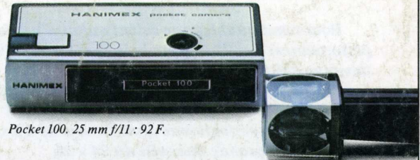
Pocket 100. 25 mm f/11 : 92 F.