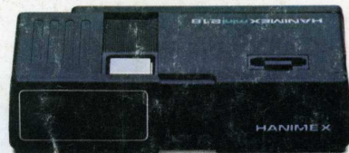
Pocket 218. 27 mm f/9,5 : 150 F (en coffret avec flash et film).

Des dizaines de pockets différents, tous aussi simples, tous aussi peu encombrants. Lequel choisir?