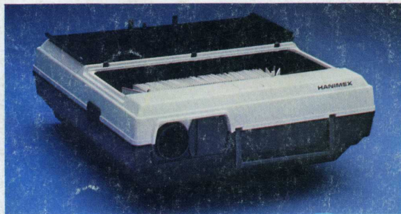
Rondette 110 : 799 F.

Pour obtenir la liste des points Phox et toute documentation complémentaire, écrivez à Phox, 36, rue Rivay, 92300 Levallois.