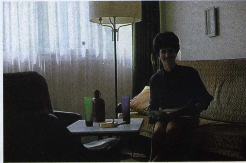
bonne photo mais le contre jour dissimule le sujet