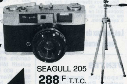
SEAGULL 205 288 F T.T.C.