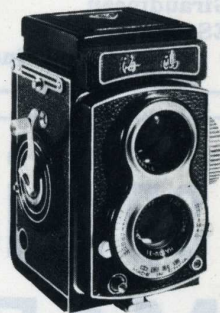
SEAGULL 4 A 495 F T.T.C.