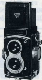
SEAGULL 4 378 F T.T.C.