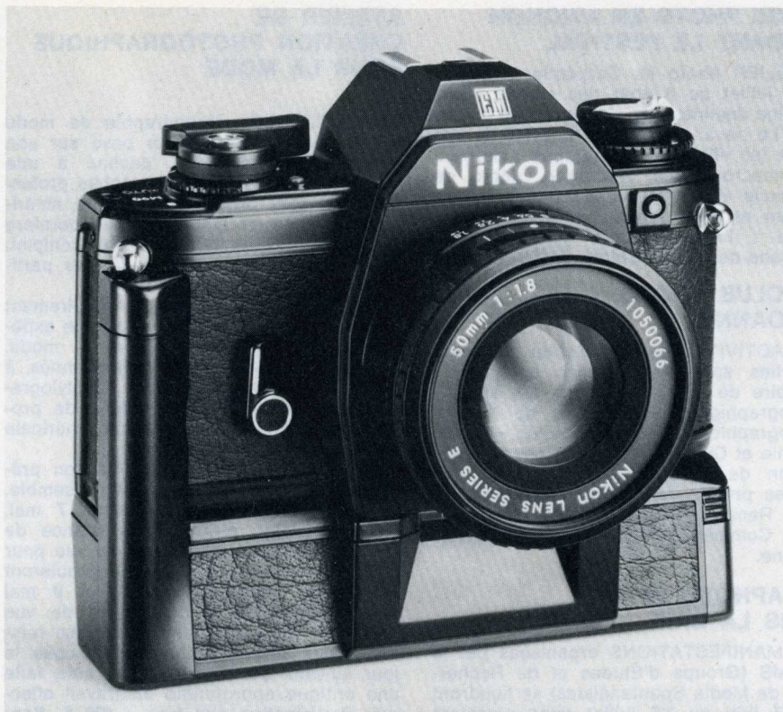
Le Nikon EM avec son moteur MD-E et l'objectif E 1,8/50 mm.