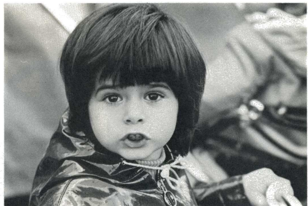
Komuranon f : 4,5 de 300 mm. f : 5,6; 1/30°. Sans pied.

placer des bagues allonge derrière l'objectif si l'on veut faire de très gros plans. Enfin pour terminer, signalons que ces optiques sont livrées dans des coffrets (devrait-on dire des écrins) véritablement luxueux avec une courroie pour les porter en bandouillère. C'est une qualité qui n'est pas essentielle quand on choisit un objectif mais ça fait tout de même plaisir de transporter un bel objet plutôt qu'un étui minable qui pendouille!