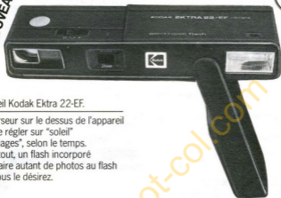
appareil Kodak Ektra 22-EF.

Un curseur sur le dessus de l'appareil pour le régler sur "soleil" ou "nuages", selon le temps. Et surtout, un flash incorporé pour faire autant de photos au flash que vous le désirez.