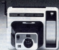
appareil Kodak EK2 (Garanti 3 ans).