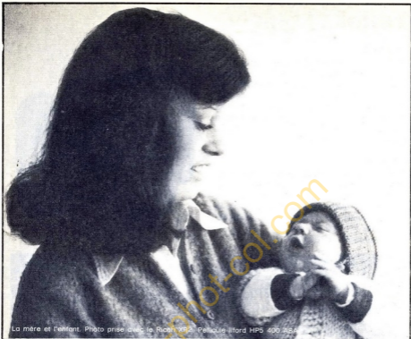
La mère et l'enfant. Photo prise avec le Ricoh XR2. Pellicule Ilford HP5 400 ASA.