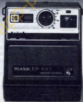
appareil Kodak EK100 (Garanti 3 ans).

La simplicité d'emploi Kodak. La robustesse Kodak. La couleur Kodak tout de suite.