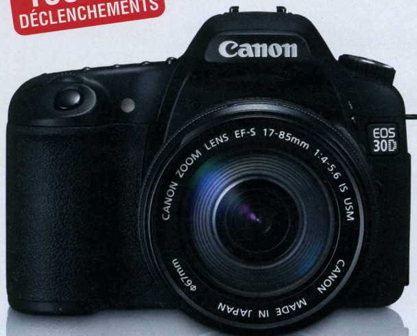
CANON EOS 30D

8 M.PIXELS 30 à 1/8000e VITESSE 2,5" ÉCRAN LCD 5 IMAGES 700 POINTS (m)