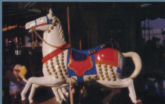
Avec filtre N°2