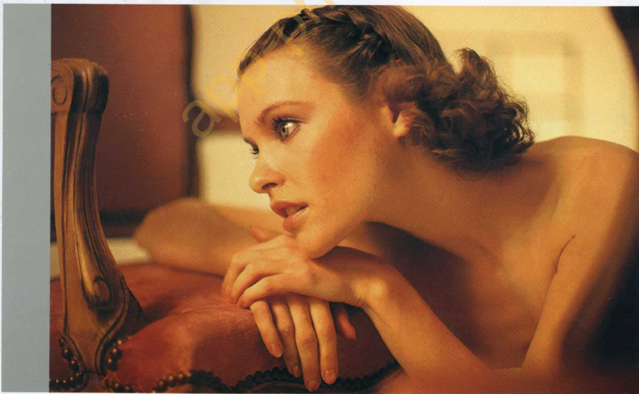
50 mm f/1,2 Nikkor: à f/1,2, 1/125 sec.