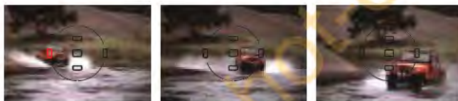
AF dynamique: le système conserve la mise au point sur le sujet même si celui-ci sort de la zone sélectionnée, en changeant automatiquement de collimateur AF.

Les systèmes de multi-capteur TTL à cinq segments et de pré-éclair du F75 permettent de contrôler précisément l'intensité de l'éclair pour créer une image équilibrée, en analysant la luminosité de la scène, le contraste et la réflectance du sujet juste avant le déclenchement.