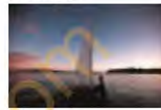
V leur mesurée