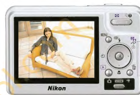
Capturez l'instant décisif