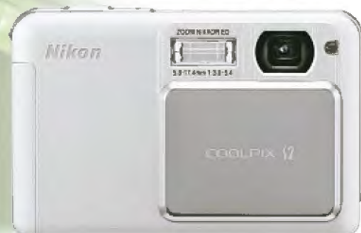
Priorité à la qualité