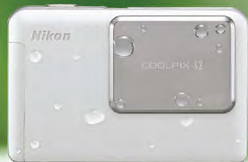
Suivez le courant