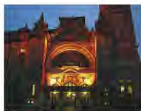
Paysage de nuit