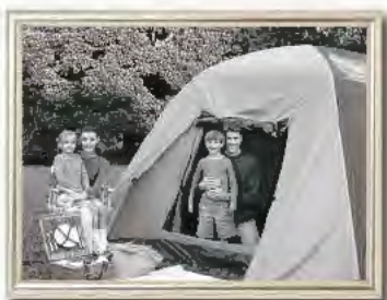
Noir et blanc