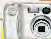
COOLPIX 2200 2 millions de pixels effectifs