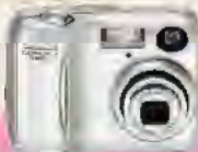
COOLPIX 3200 3,2 millions de pixels effectifs

Compacts et légers Zoom-Nikkor optique 3x 15 modes Scène