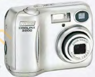
COOLPIX 2200 2 mégapixels effectifs