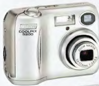
COOLPIX 3200 3,2 mégapixels effectifs