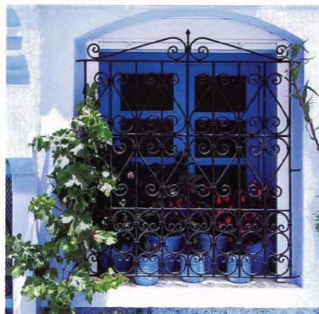
f = 28 mm ISO 100 EV-0,3 BB : AUTO