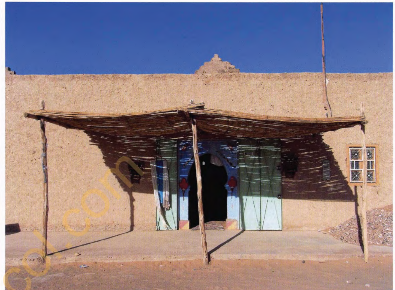
f = 28mm ISO100 EV±0 BB : AUTO