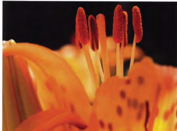
f = 200 mm ISO 100 EV-0,3 BB : Manuelle