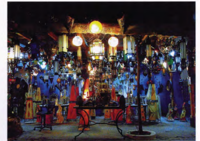
f = 28 mm ISO 800 EV-0,3 BB : AUTO