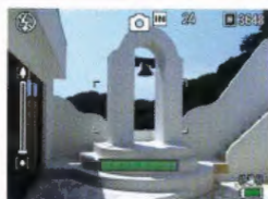
* Simulation d'image

Grâce au témoin sonore de niveau et à l'indicateur de niveau affiché sur l'écran, vous pouvez être sûr que l'image est au niveau au moment de la prise de vue. Cela est pratique lorsque vous souhaitez éviter toute inclinaison du sujet quand vous prenez des scènes de paysage ou de bâtiments.