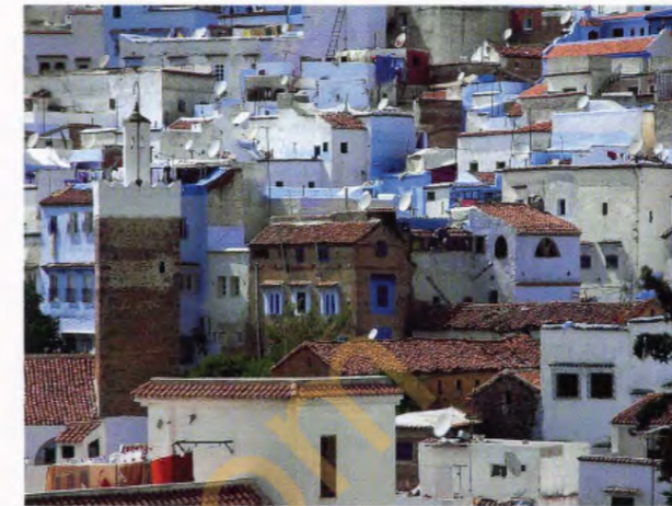
f = 200 mm ISO100 EV±0 BB : AUTO