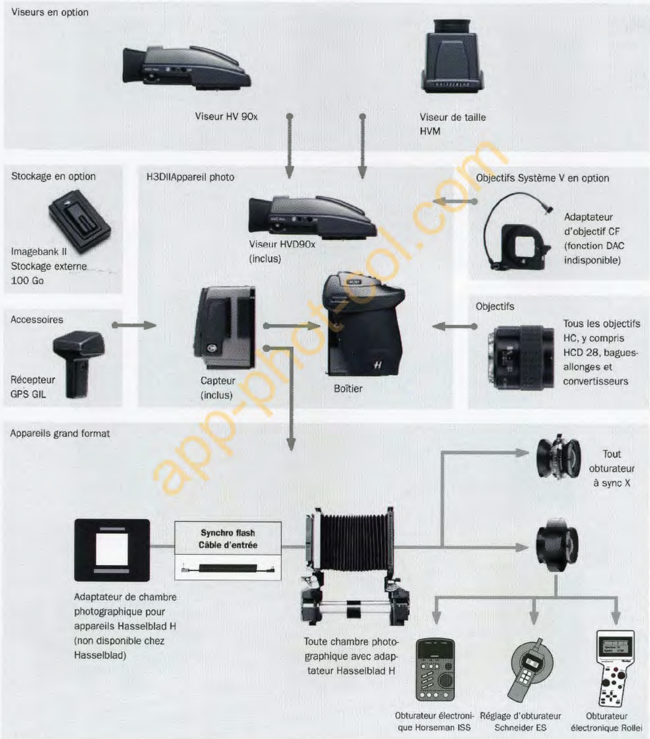
Schéma de connexion