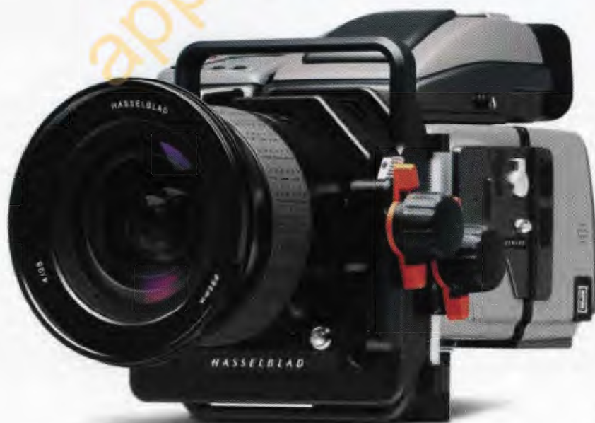
H3DII avec adaptateur HTS 1.5 tilt/shift et objectif HCD 28 mm.

Voir la fiche technique de la chambre photographique Hasselblad pour plus de détails.