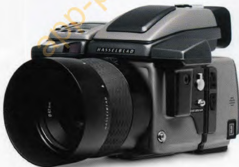
H3DII avec dispositif d'enregistrement GIL GPS.